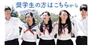
奨学生の方はこちらから