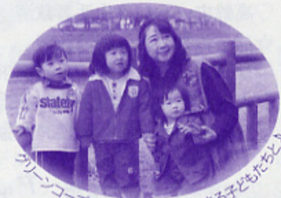
グリーンコープでであった未来を生きる子どもたちと