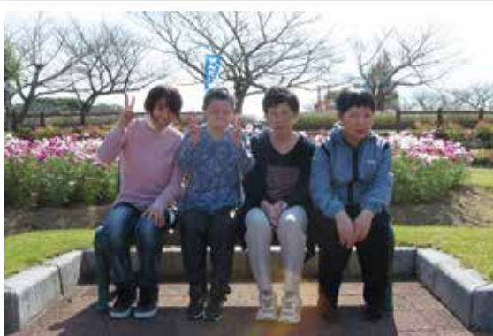
公園でお弁当を食べました。