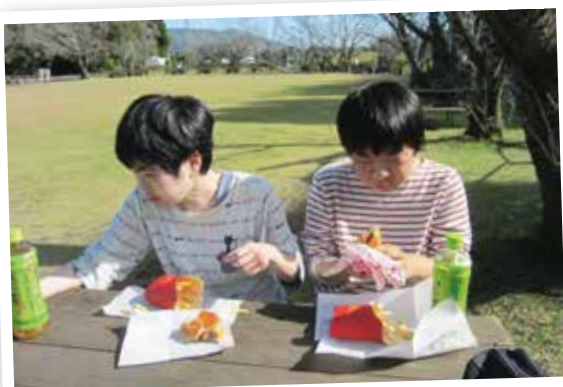
大好きなハンバーガー