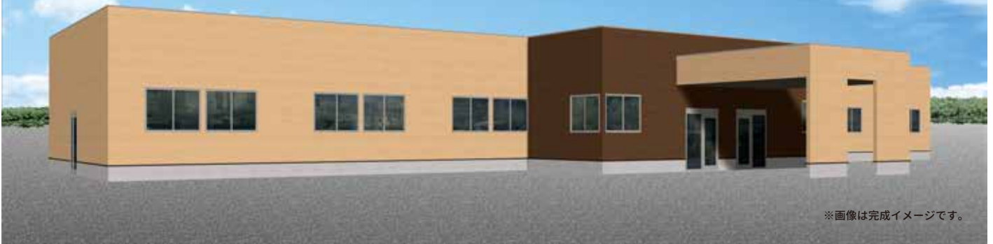
※画像は完成イメージです。

利用者様が地域において、家庭的な環境及び地域住民との交流のもとで、自立した日常生活又は社会生活を営むことができるように支援します。また、地域で生活する障害のある方の緊急一時的な支援等に応じるために、短期入所も行います。