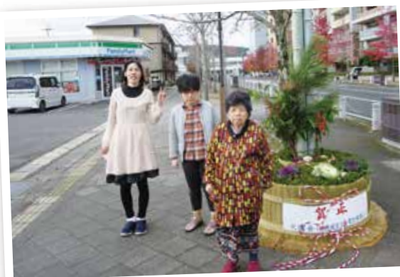
コンビニで買い物