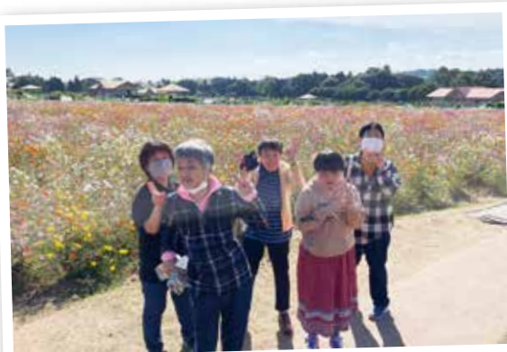
コスモスでいっぱい