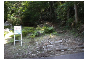
林道の幅箇所にて駐車可能